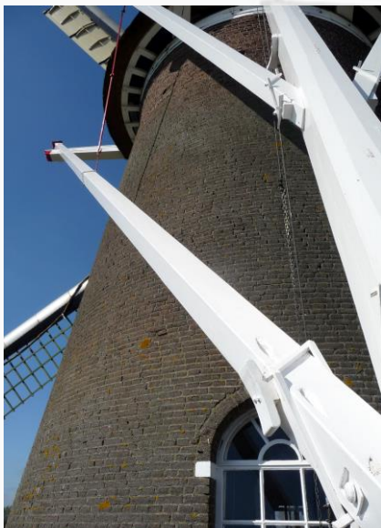
De nieuwe linker schoor

Wie geniet er niet van een draaiende molen? Is het u al opgevallen dat de molen veel vaker