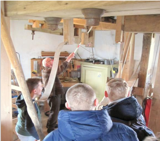
Uitleg, hoe wordt de steen gelicht?