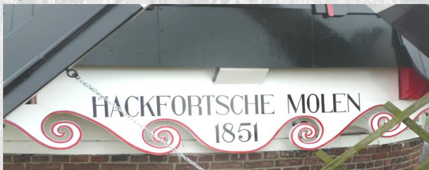
De naam op de baard

maatschappelijk invulling te geven. Zo bezochten al jaren lang lagere schoolklassen de molen voor het molenspel en recent hebben we een drietal klassen van het Beeckland op bezoek gehad voor hun les in techniek met als thema: de "Middeleeuwen". De evaluatie moet nog plaatsvinden maar het lijkt voor herhaling vatbaar.